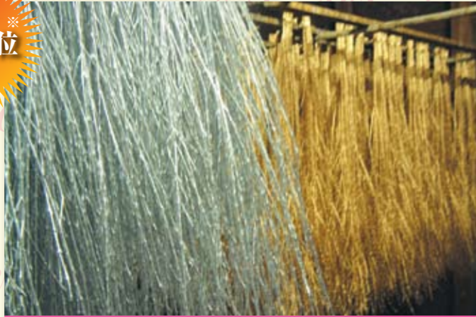
枝物の金銀ペイント加工品