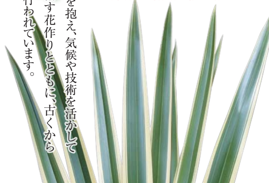
New Zealand flax

全国有数の花の消費地「金沢」を抱え、気候や技術を活かして特徴的な品目で日本一を目指す花作りとともに、古くから地産地消の伝統ある花作りが行われています。